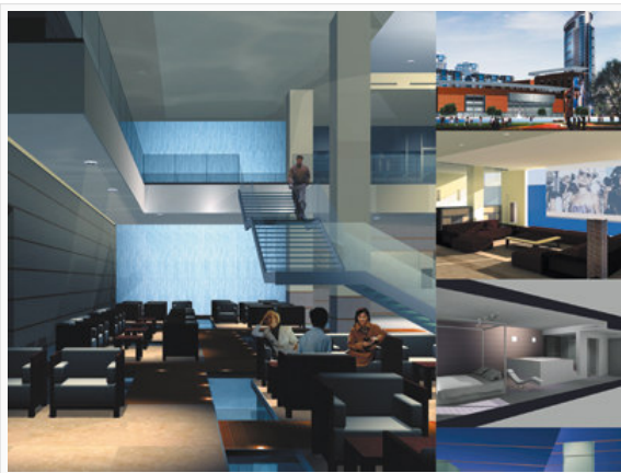
Sol Melia – Milano - Incarico dal SOL MELIA MILANO di riprogettare e rinnovare la Suite Ambassador.